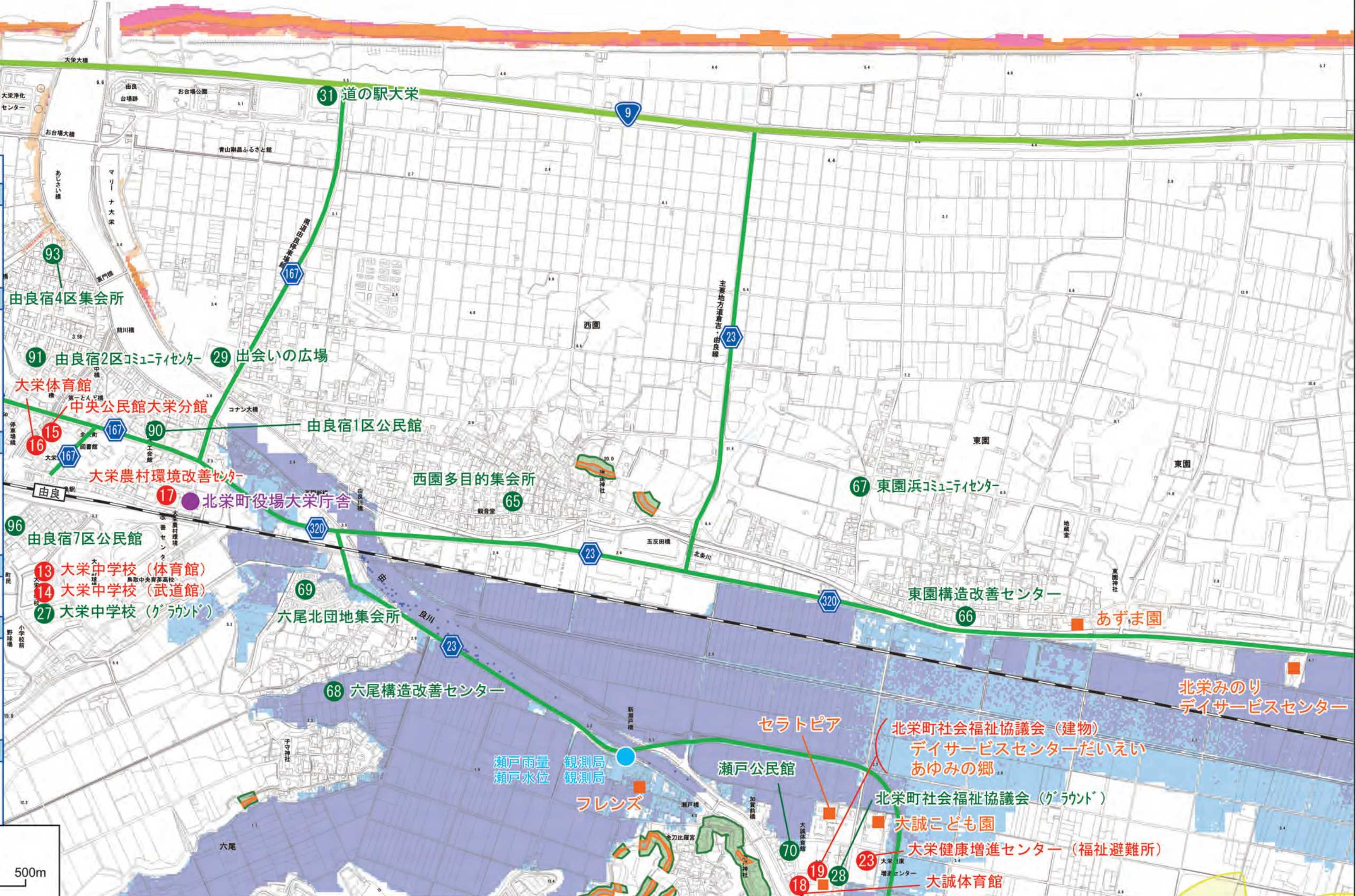
21 【河川洪水時浸水深（計画規模）について】…毎年、年間に1/100（1%）の確率で発生するほどの大雨（24時間に352mm）にともなう洪水により、河川が氾濫した場合に想定される水深を表示した図面です。