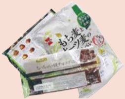
お菓子、パン等の包装類