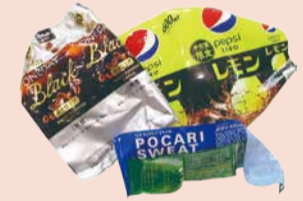
ペットボトルラベル