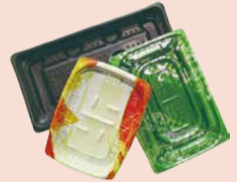
弁当・総菜等の容器類